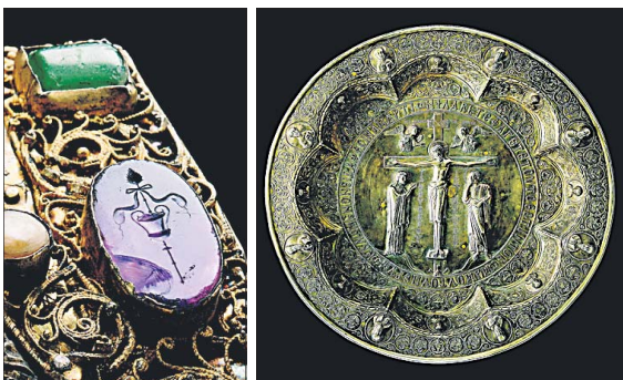
Aus dem Domschatz Halberstadt: Ein Detail vom Armreliquiar des Heiligen Stephanus, um 1205 (links) und ein byzantinischer Diskos, erbeutet beim 4. Kreuzzug, entstanden zwischen 1050 und 1190. Abbildungen aus dem besprochenen Band

HARALD MELLER, INGO MUNDT, BOJE SCHMUHL (Hrsg.): Der heilige Schatz im Dom zu Halberstadt. Fotos von Juraj Lipták, Verlag Schnell & Steiner, Regensburg 2008. 436 S., 59 Euro.