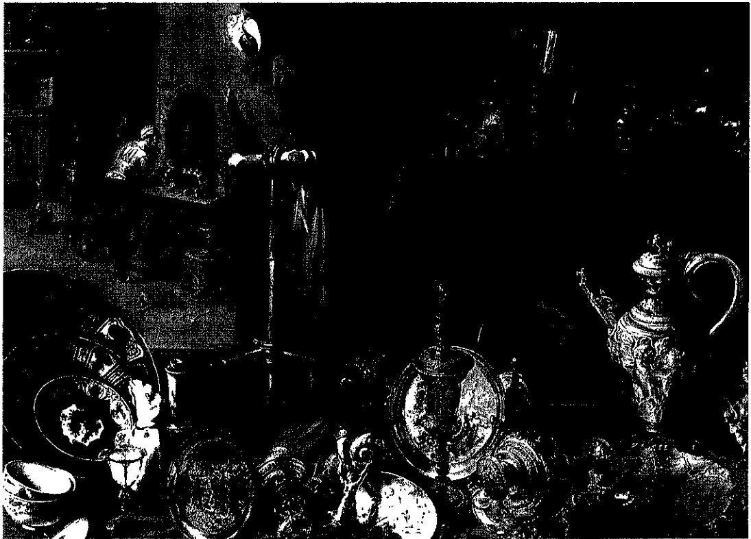
Abb. 1 Adriaen van Utrecht, Allegorie des Feuers, 1636. Brüssel, Musées Royaux des Beaux-Arts de Belgique (Ausst.kat. Kunst und Alchemie 2014, S. 135)

ivationen der 1 Zentrum des och in einigen dingungen für neuzeitlichen weniger be- n werden pro- n vorgestellt. n Beitrag ein- Conticelli im tiner Ausstel- , 15.12.2012-